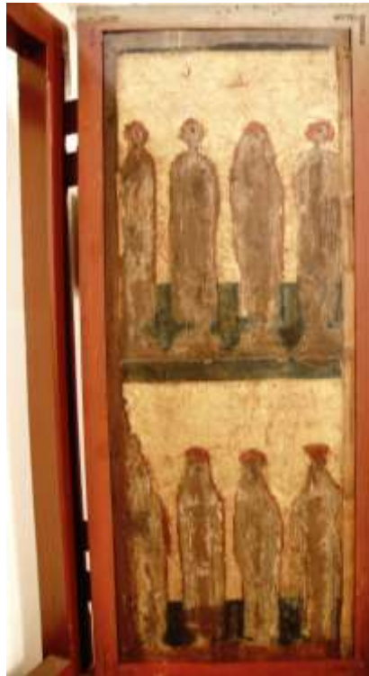
2. Warsztat Mistrza Ołtarza z Gościszowic, Poliptyk sulechowski, 1499, awers skrzydła lewego wewnętrznego