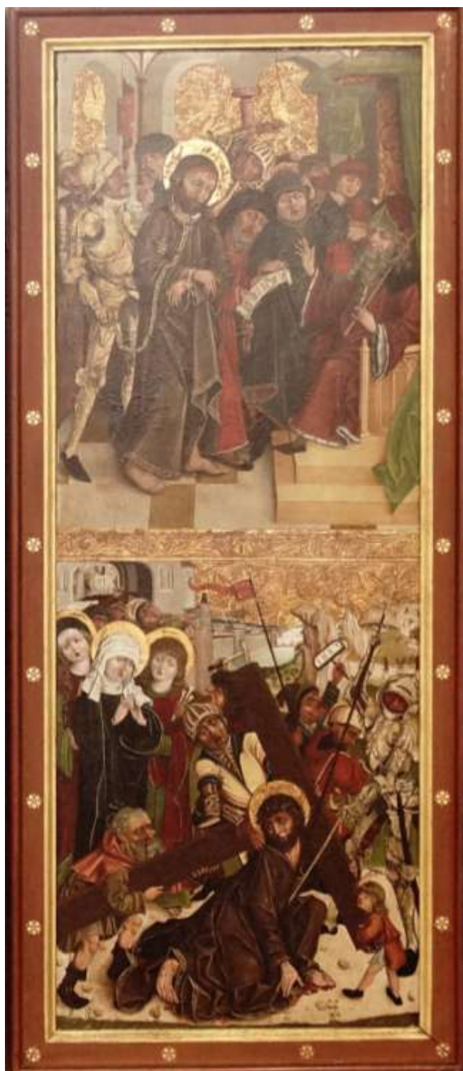
6. Warsztat Mistrza Ołtarza z Gościszowic, Poliptyk sulechowski, 1499, rewers lewego skrzydła wewnętrznego, kwatery – Jezus przed Piłatem i Upadek pod krzyżem; fot. Kazimierz Furman