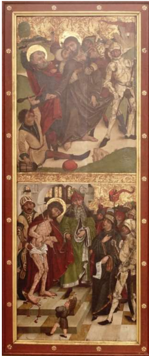
5. Warsztat Mistrza Ołtarza z Gościszowic, Poliptyk sulechowski, 1499, rewers prawego skrzydła wewnętrznego, kwatery – Pojmanie i Ecce Homo