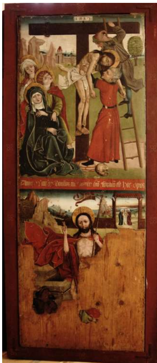
7. Warsztat Mistrza Ołtarza z Gościszowic, Poliptyk sulechowski, 1499, rewers prawego skrzydła zewnętrznego, kwatery – Zdjęcie z krzyża i Zmartwychwstanie