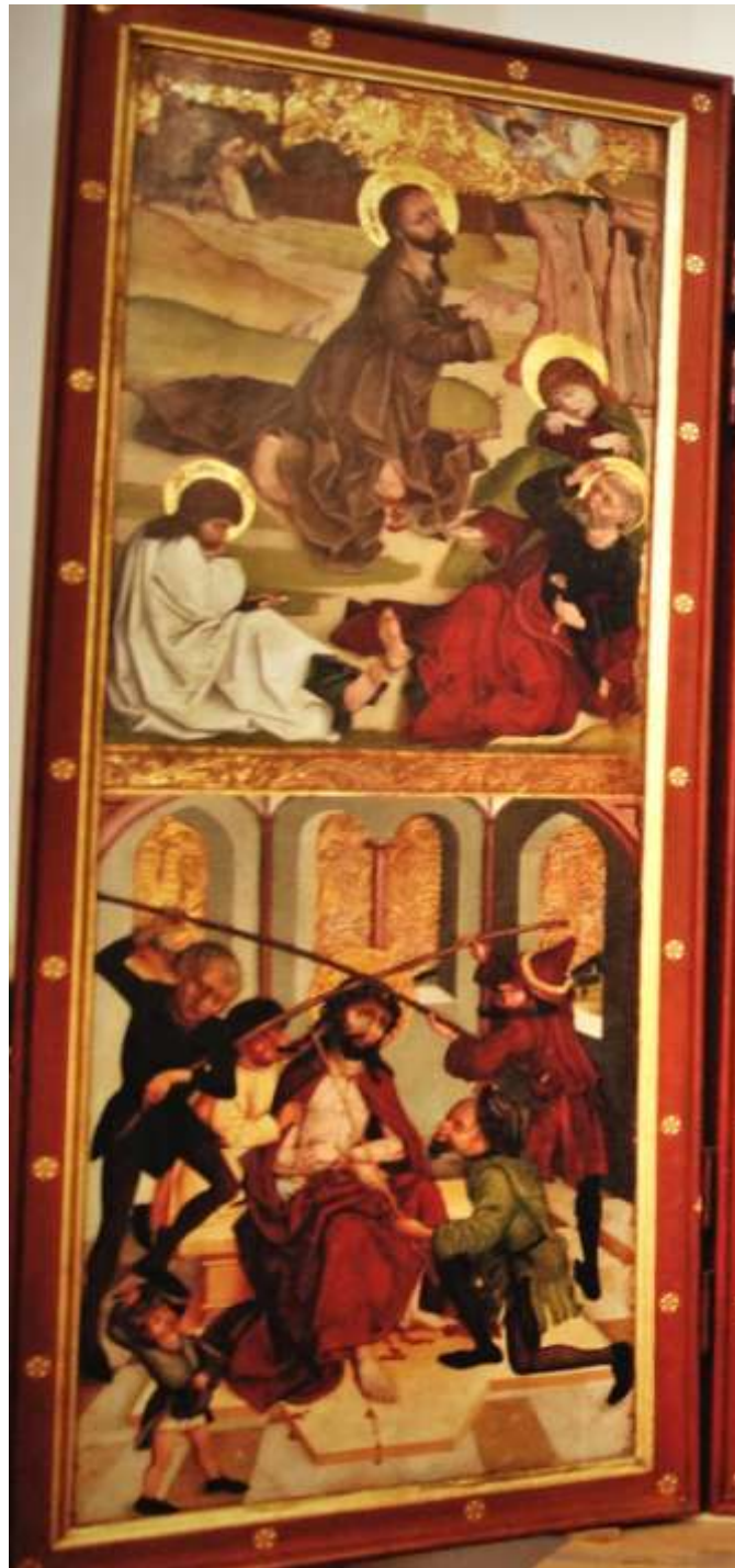
3. Warsztat Mistrza Ołtarza z Gościszowic, Poliptyk sulechowski, 1499, awers prawego skrzydła zewnętrznego, kwatery – Modlitwa w Ogrójcu i Koronowanie cierniem